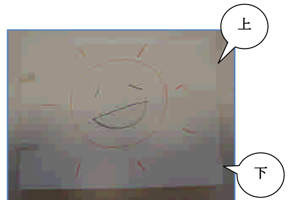
図3 完成したマジックブック

④図3の上の部分をもって、パラパラとめくると絵が消えてしまいます。反対に、下の部分をもって、パラパラとめくると絵が現れます。紙の枚数を多くして作ると、よりおもしろいですよ。