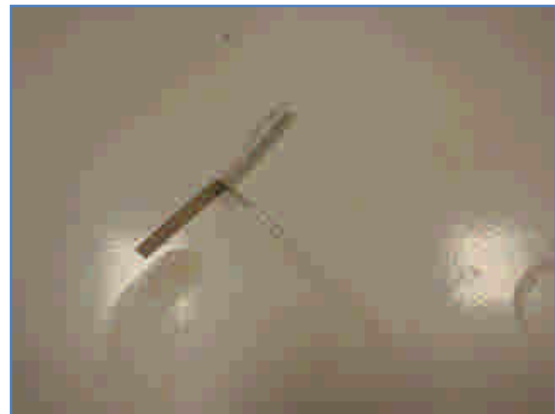
図1 完成した紙トンボ