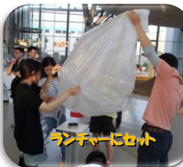
ランチャーにセット