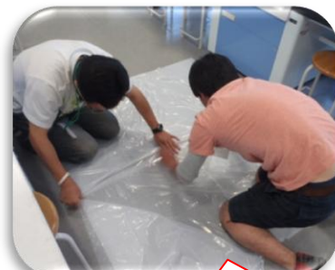
テープではり合わせよう