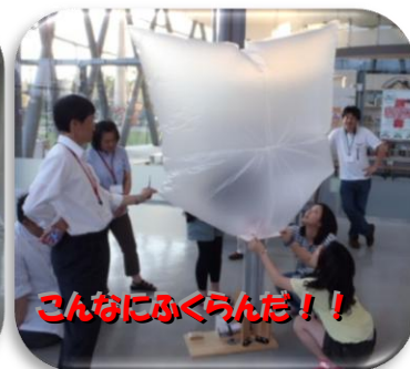
こんなにふくらんだ！！