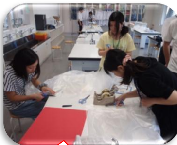
袋をはさみで切って