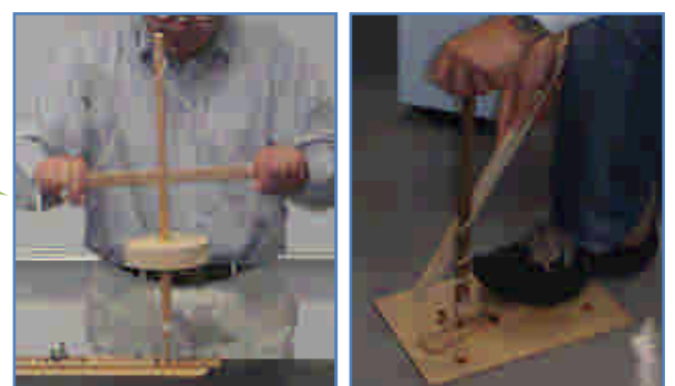
図4 その他の火おこしの方法

※遊学館に問い合わせると、‘きりもみ式’以外の火おこしの道具を借りることができます。いろいろな火おこしに挑戦してみてください。