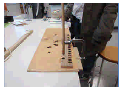
図2 火おこしの準備をする

※遊学館に問い合わせると、‘きりもみ式’以外の火おこしの道具を借りることができます。いろいろな火おこしに挑戦してみてください。