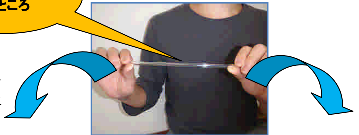
図2 ガラス管を切る