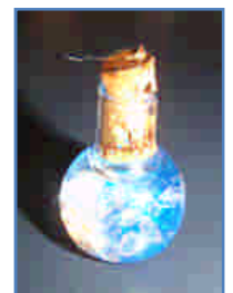
図5 ミニフラスコの完成