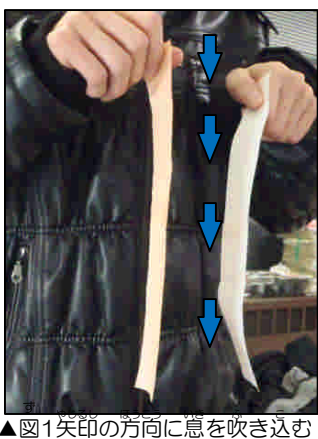
▲図1矢印の方向に息を吹き込む

飛行機とベルヌーイの定理 このベルヌーイの定理が飛行機の飛び理由の一つであると考えられています。