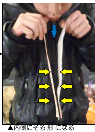
▲内側にそれる形になる